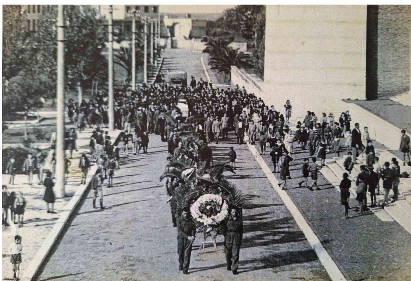
23 novembre 1946, funerale solenne degli sminatori, il corteo parte dall'ex ospedale in cui era stato portato ciò che rimaneva delle salme