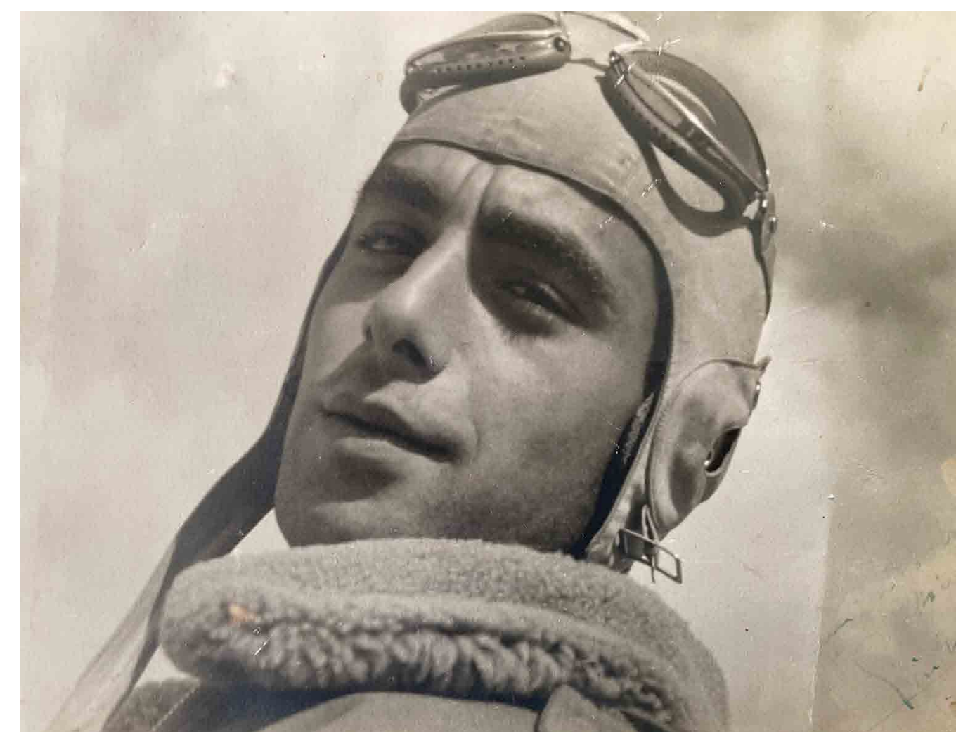
Giuliano Cattani, pilota, eroe della seconda guerra, pluridecorato e vittima della mina marina nel 1946 a Caterattino

Proprietà letteraria riservata all'autrice Daniela Carfagna. Nessuna parte della mostra può essere copiata e riprodotta senza la dovuta autorizzazione. L'opera di restauro è stata attuata dal Comune di Sabaudia con il contributo della Presidenza del Consiglio dei Ministri, Struttura di missione per la valorizzazione degli anniversari nazionali e della dimensione partecipativa delle nuove generazioni