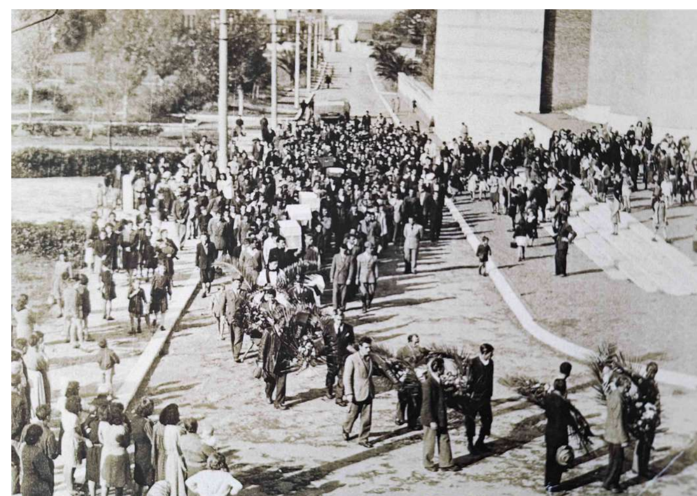
Il funerale accompagnato dalle autorità e dalla cittadinanza commossa sta per raggiungere il sagrato della chiesa Santissima Annunziata di Sabaudia