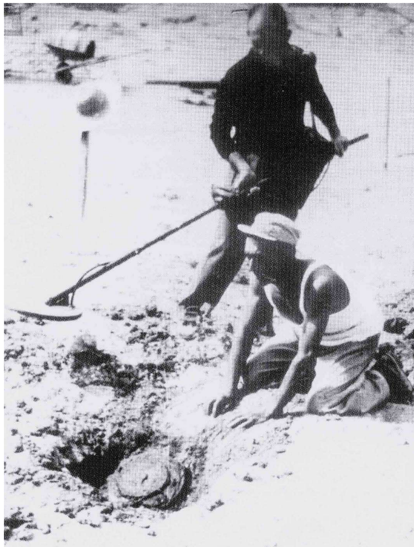
Rastrellatori in opera sul litorale pontino