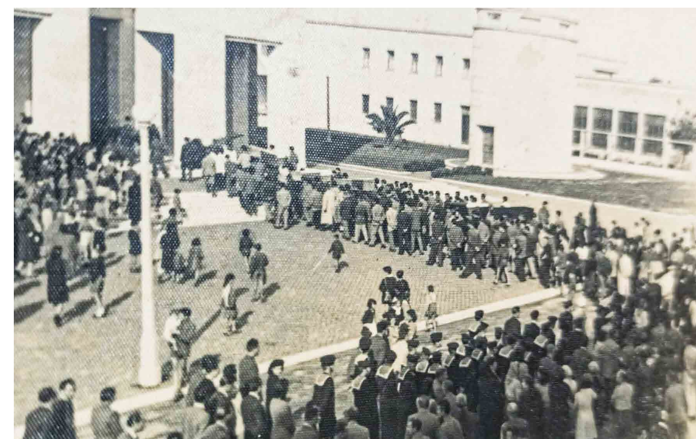
Le salme e la processione che le accompagna hanno raggiunto l'ingresso della SS Annunziata

Informazioni tratte dal sito internet https://www.onorbcm.it/ElencoCaduti-BCM.asp COMITATO PER LA MEMORIA DELLA B.C.M. (Bonifica Campi Minati)