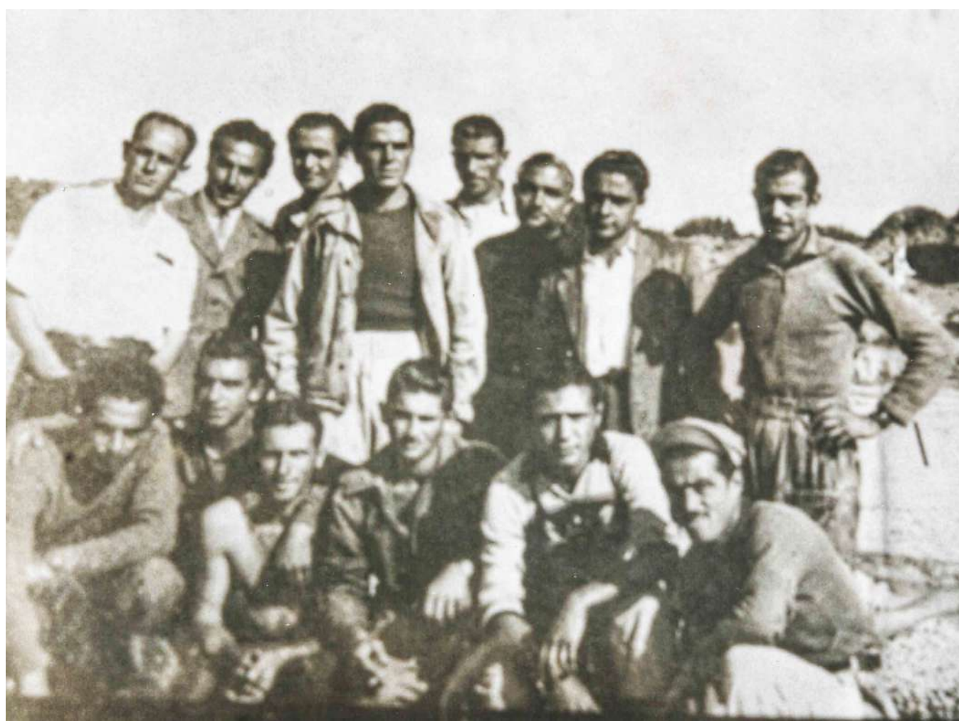
Gruppo di sminatori della sezione di Sabaudia